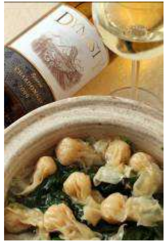
傳統粵菜家常菜式白鷺雲吞浸菠菜，味道輕淡清新，配以王朝珍藏霞多麗 2006 年白葡萄酒。