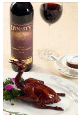
肉味濃郁的菜式紅燒妙齡鴿，配以馥郁醇厚的王朝 - 皇族系列珍藏赤霞珠 2006 年。